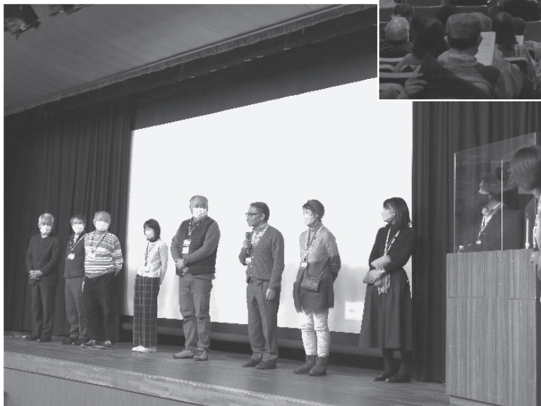
地域の支援団体の活動を紹介しました