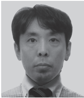
神戸市外国語大学 消費生活協同組合 専務理事