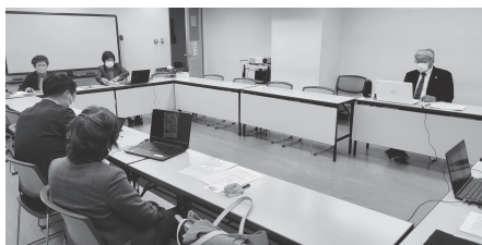
県民会館からオンライン配信

講演では、私達の日常生活の様々な場面で目にする広告に潜むリスクについて、イラストを用いて数多くの事例を示されました。終了後のアンケートでは、「インターネット広告を見極めるためのポイントがわかりやすく勉強になった」「質疑応答の時間が長くてよかった」などの感想が寄せられました。