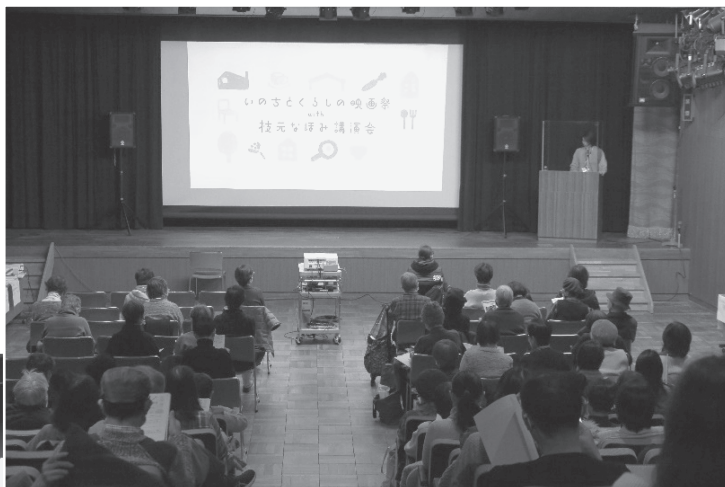
映画「家族を想うとき」を上映