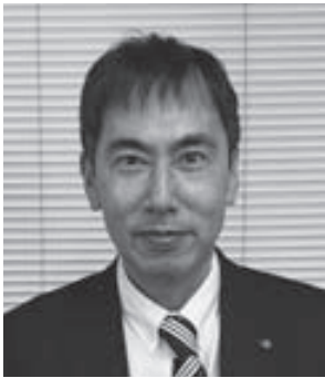
共栄火災海上保険株式会社 神戸支店 支店長