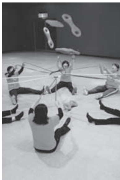
「3B体操教室」で楽しく体を動かす参加者

JAでは今後も、地域の人々がつながりを深め、健康でいきいきと暮らし続けられるよう取り組んでいきます。