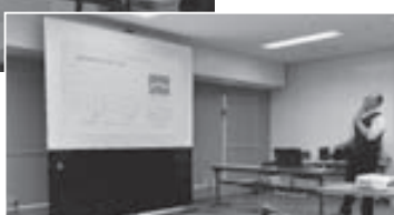
久保主任研究員の講演の様子