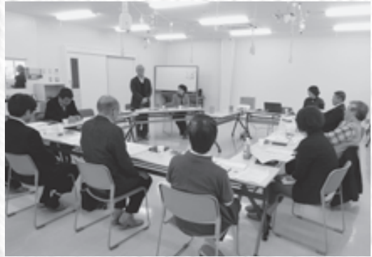
「おたがいさま」概要説明

11月30日(金)～12月1日(土)、今年度の保健・医療・福祉研究会のテーマである「助け合い」の先進事例を学ぶため、鳥根県の有償たすけあいシステム「おたがいさま」(鳥根県)を訪ねました。参加したのは保・医・福祉研究会のメンバーや会員生協の福祉担当者ら8名。