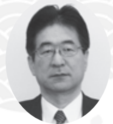
尼崎市民共済生活協同組合 理事長