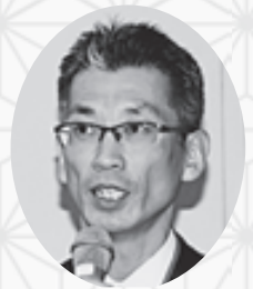
大学生協事業連合 (関西北陸地区) 専務理事 (地区業務統括)