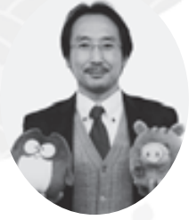
神戸親和女子大学 生活協同組合 専務理事