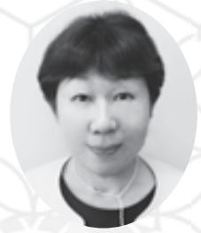
神戸市民生活協同組合 専務理事