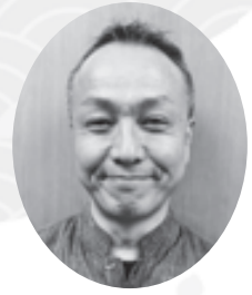
ひまわり医療生活協同組合 副理事長