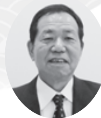
近畿労働金庫 兵庫地区本部 本部長