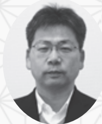
生活協同組合連合会 コープ自然派事業連合 理事長