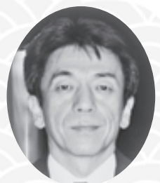
たじま医療生活協同組合 専務理事