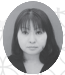
甲南大学生生活協同組合 専務理事