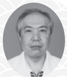
神戸医療生活協同組合 理事長

我々は「広域化による事業強化」と「会員生協が組合員に向き合う力の強化」という2つの課題をバランス良く実現し、組合員のキャンパスライフの向上に尽力する所存です。本年もよろしくお願い申し上げます。