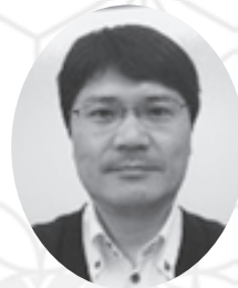
阪神医療生活協同組合 専務理事