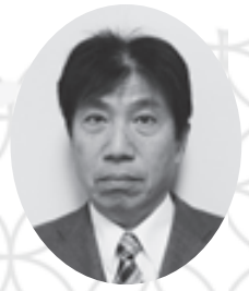
姫路市民共済生活協同組合 理事長