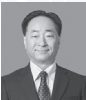
兵庫県生活協同組合連合会 会長理事