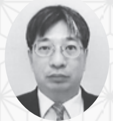
兵庫県立大学生生活協同組合 専務理事