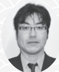
西宮市職員生活協同組合 事務局長