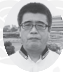
宝塚医療生活協同組合 専務理事