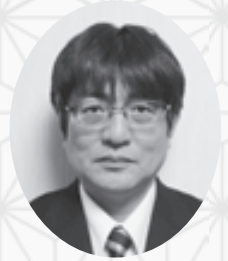
ろっこう医療生活協同組合 専務理事

「楽しく、おいしく、オシャレ」な組合員活動と在宅ニーズに応える事業所がしっかり連携し、地域により開かれた運営をおこないます。国連が定めたSDGs(持続可能な開発目標)を具体化し、新たな挑戦の年にしたいと考えています。今年もよろしくお願いたします。