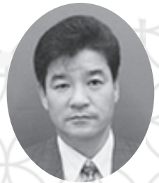
神戸市立工業高等専門学校 生活協同組合 専務理事