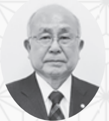
西宮市民共済生活協同組合 常務理事 兼 事務局長

この先人の努力と成果を受け継ぐと伴に、新たな元号の時代につきましても、組合員の方々の気持ちに寄り添い、「安全」と「安心」をお届けする活動に重点を置き、顔と顔の見える関係や助け合いの精神を大切に、確実に事業を継続していくよう努力してまいりたいと考えておりますので、今後におきましてもご指導・ご鞭撻のほどよろしくお願い申し上げます。