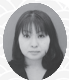
神戸薬科大学生活協同組合 専務理事