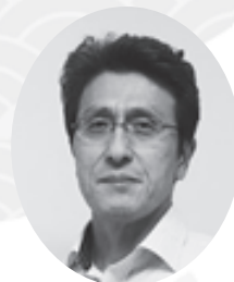
尼崎医療生活協同組合 理事長