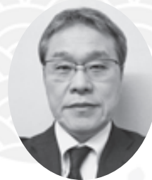
生活クラブ生活協同組合 都市生活 専務理事