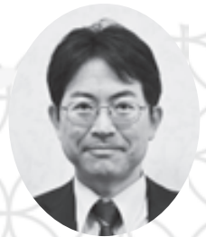
姫路医療生活協同組合 専務理事