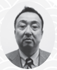
兵庫労働共済生活協同組合 専務理事

私の帰る日を、尻尾を長くして待っていた猫たちの歓喜の猫パンチが最大のご褒美でした。本年もご指導・ご鞭撻のほどよろしくお願い申し上げます。