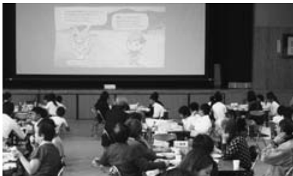
豊かな海について学習しました