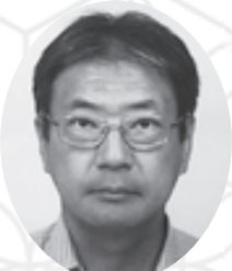
園田学園女子大学 生活協同組合 専務理事