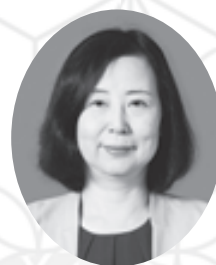
生活協同組合コープこうべ 常勤理事