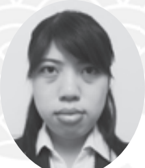
甲南女子大学生協 専務理事