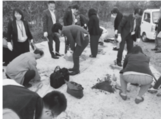
尼崎の森中央緑地

兵庫県協同組合連絡協議会（兵庫 JCC）では、各協同組合が持ち回りで担当し、年に1度、互いの活動や事業を紹介し、理解と交流を深めようと2008年から協同組合研究交流会を開催しています。生協が当番の今年は、11月6日（火）、爽やかな秋晴れのもと、各協同組合の組合員や役員・職員ら33人が参加して開催しました。（関連記事 P16）