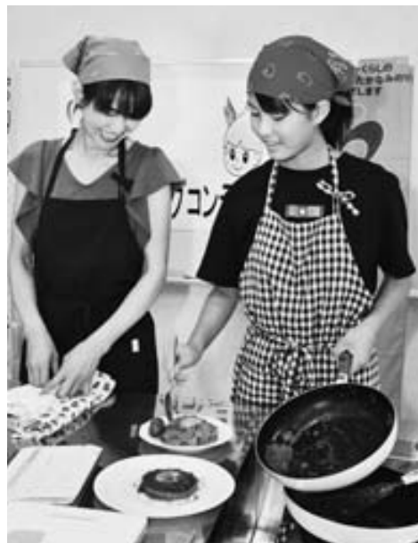
自ら考えたタマネギ料理を調理する参加者

また、8月には、消費拡大と次世代組合員との関係強化を目的にして、タマネギをテーマとした親子クッキングコンテストを開きました。書類審査を通過した4組の親子がタマネギ料理を披露しました。同JAは「コンテストをすることで、地域の皆様に地元でタマネギが生産されていることを知ってもらい、タマネギの消費を増やし、農家の所得増大につなげていきたい」と話しています。