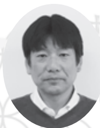
生活協同組合 コープ自然派兵庫 専務理事