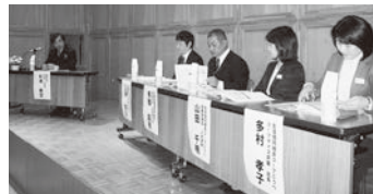
協同組合の役割を果たすための人づくりについて考えました

う一度そういう協同組合をつくらうという動きが始まっていて、組合員の声を聴くだけでなく、そうした動きをキャッチして自分たちの協同組合に取り入れることが職員には求められている」と、今後の協同組合の方向性をご示唆いただきました。