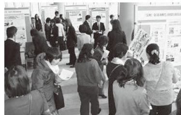
壁新聞の活動紹介に見入る参加者

消費者一人ひとりが、消費者問題について「気づく」「伝える」ために、さまざまなネットワークで人と人が「つながっていく」ことを感じる一日となりました。