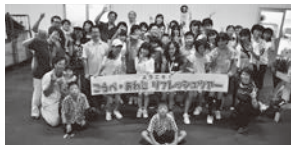
リフレッシュツアー