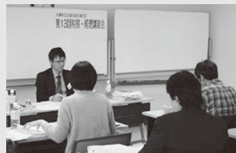
中上級・ 関連子会社クラス

てくるので、ルーチンの作業だけでなく、活用できるように加工し、他部署や上層部に提言することが必要と感じました」「今まで知らなかった税務上の経理の考え方がわかって良かった」「法人税、税務を身近に感じる事ができた」などの感想が寄せられ、決算にむけて実践に役立つ講習会となりました。