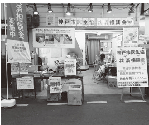
市場に溶け込んでがんばりました