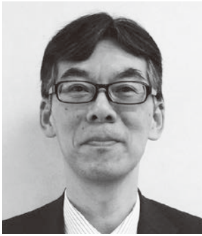
全国大学生協連 大阪・兵庫・ 和歌山ブロック 事務局長