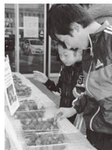
イチゴをおいしそうに味わう来店者

JA 兵庫みらい加西市いちご部会は1月7日、同JA農産物直売所『かさい愛菜館』でイチゴの試食会を開きました。同直売所は、この日が新年の営業始め。訪れた多くの買い物客らが、試食コーナーに並べられた「さがほのか」「紅ほっぺ」「とちおとめ」「根 ね 日 ひ 女の恋詩（さちのか）」の4品種を手に取り、豊かな味わいに舌鼓を打ちました。