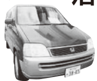
名称募集中の神戸ナンバーのワゴン車

救援物資の物流にはトラックが当たり前ですが、運転手を含めて8人乗れるワゴンはたくさんの人手が必要となる活動には不可欠です。神戸ナンバーのワゴンは、支援活動の貴重な戦力として重宝されている様子です。ところで、生活クラブ岩手ではこのワゴンの名称を公募しているのだそうです。