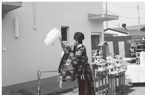
事務所や農業機械に対するおはらい