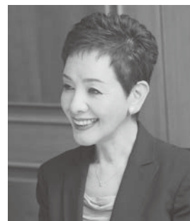
講師 浜 美枝氏

昭和18年東京生まれ。女優・司会・パーソナリティなど幅広い活動とともに、現在は農林水産省などの各審議会委員として「農・食・文化の継承」について積極的な実地活動を展開中。昭和35年 東宝よりデビュー。昭和42年 映画「007は二度死ぬ」。昭和50年以降「小川宏ショー」、「いい朝8時」、「脱線問答」、「日曜美術館」などにテレビ出演。他にラジオ番組にも出演。日経新聞連載、著書出版など執筆活動も。平成22年4月 近畿大学総合社会学部客員教授就任。