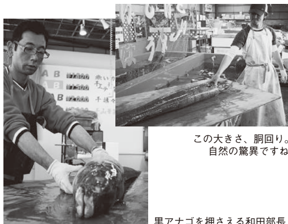
この大きさ、胴回り。 自然の驚異ですね