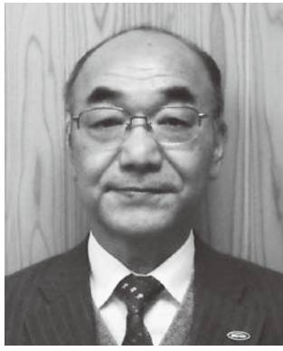
兵庫県森林組合連合会 専務理事