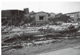
辺りはこの様な状況で入浴できることはありません