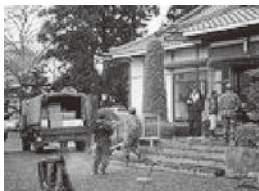
自衛隊による救援物資の搬入で物資は充足しつつあります