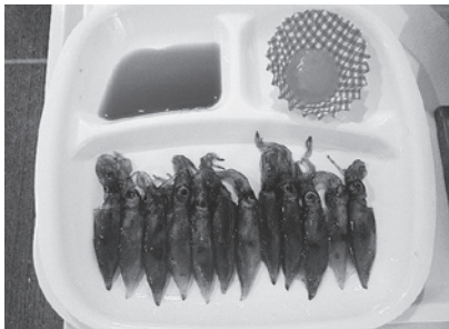
ほたるいかのしゃぶしゃぶ