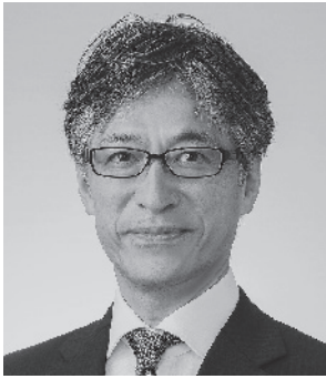
一般社団法人日本協同組合連携機構 (JCA) 代表理事専務