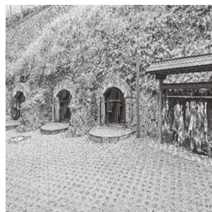
山里小学校 防空壕跡