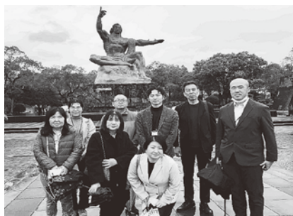
平和公園 平和祈念像前