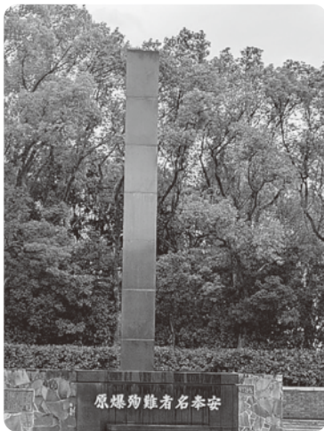
原子爆弾落下中心地碑

ピースアクション委員会では、「平和で安心してらせる社会の実現に向けた取り組み」を目的として活動しています。 2025年度は戦後80年として、広島、長崎の被爆地訪問の取り組みを企画・実施しました。