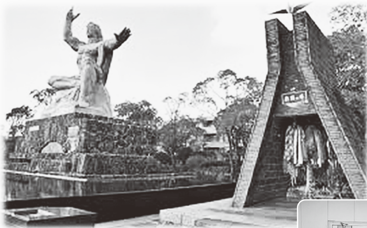
平和公園 平和祈念像と折り鶴の塔