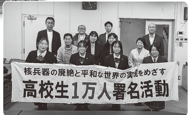
高校生平和大使との交流