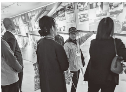
平和案内人によるガイド