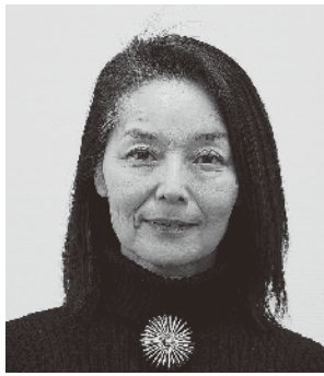
生活協同組合連合会コープ自然派・ オレンジコープ事業連合 理事長