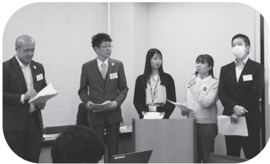
知っとお？協同組合