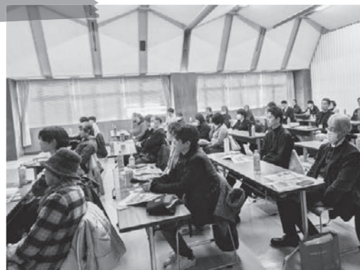
神戸市漁業協同組合 意見交換会