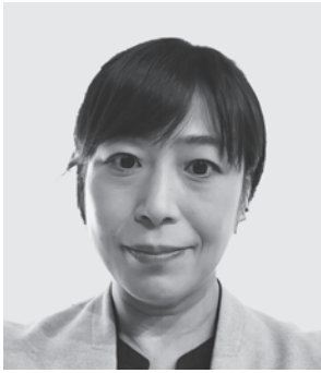
日本生協連 組織推進本部 本部長