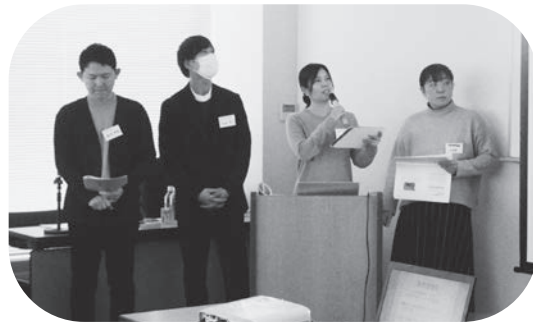
Team HIGASHINADA ♡