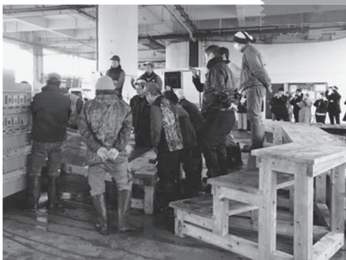
神戸市漁協協同組合 セリ見学