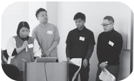
チャレンジ 防災 アクション