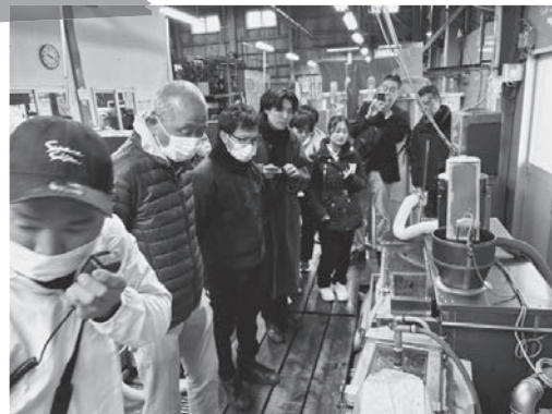
すまうら水産 のり工場見学