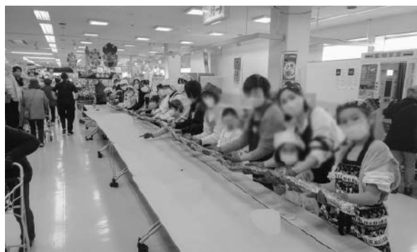
9mのジャンボ巻き寿司完成の様子

参加者の皆さんには、兵庫県の海の魅力について学び、味わって満足していただけた1日となったのではないかと思います。これからも兵庫県の海の魅力をPRする活動を行っていきます。