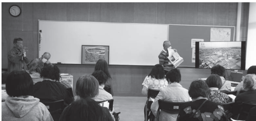
松帆市民交流センターで語り部さんのお話を聞きました

3月28日、ピースアクション2023『南あわじ戦争遺跡』を訪ねるバスツアーを開催しました。 組合員・職員あわせて34人が兵庫県内の身近な戦争遺跡を訪れ、平和への願いを強めました。 (関連ページP3)