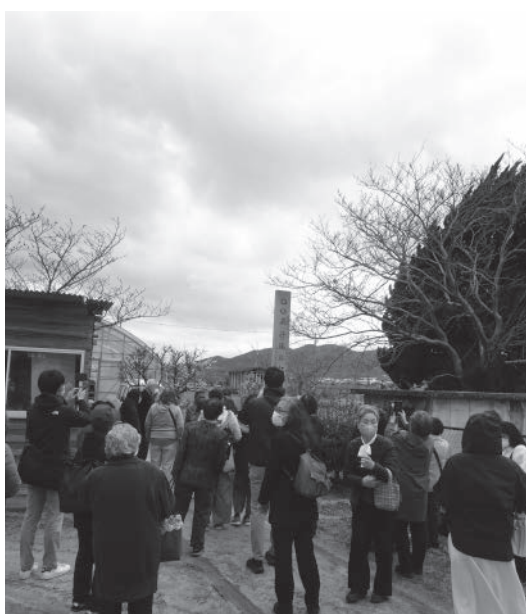
まるまる ○○飛行場跡 記念碑