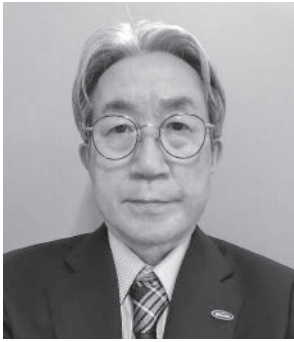
ひょうご森林林業協同組合連合会 専務理事