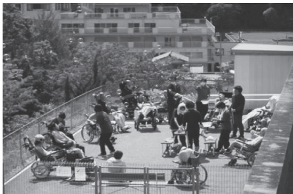
障害者支援施設 みどり荘（相生市）

赤い羽根共同募金の配分を受け、利用者が自由に移動できる人工芝の屋外遊戯場を設置させていただきました。コロナ禍で外出が制限されていましたが、遊戯場で施設利用者が笑顔でレクリエーションや日光浴をしているのを見て、職員・利用者家族一同大変ありがたく喜んでいきます。