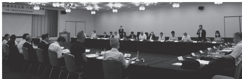
実開催にて総勢36名が出席しました