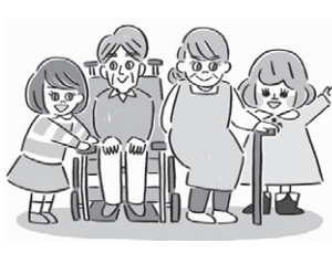
地域交流や多世代交流の活動に