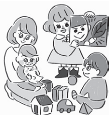
子育て活動の支援に

高齢者が気軽に集うことで、孤立感の解消と心身機能の維持向上につながるサロン活動の運営費の一部を、市内の自治会・まちづくり協議会等を対象に助成させていただきました。ありがとうございました。