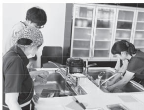
魚のさばき方実習