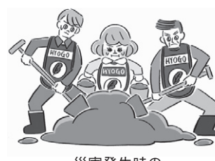
災害発生時のボランティア活動の支援に