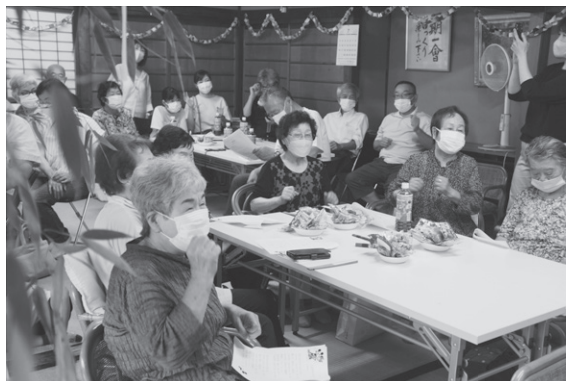
ふれあい・いきいきサロンを応援！（丹波篠山市）

赤い羽根共同募金の配分を受け、利用者が自由に移動できる人工芝の屋外遊戯場を設置させていただきました。コロナ禍で外出が制限されていましたが、遊戯場で施設利用者が笑顔でレクリエーションや日光浴をしているのを見て、職員・利用者家族一同大変ありがたく喜んでいきます。