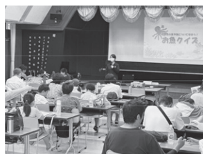
兵庫の漁業と環境についての学習

JF 兵庫漁連では、このマリンスクールを通して、漁業や水産物をより広く身近に感じてもらえるよう、今後とも取り組んでいきたいと考えています。