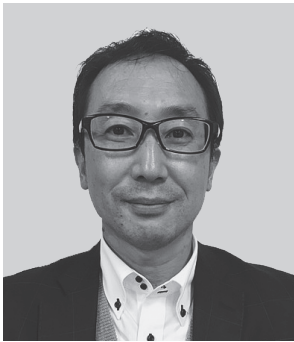
神戸大学生協同組合 専務理事 神戸親和女子大学生協同組合 専務理事 兵庫県生活協同組合連合会 理事