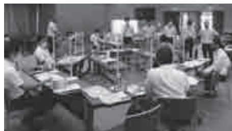
テーマ設定に向けての熱心な話し合い