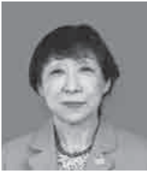
生活協同組合コープこうべ 理事 兵庫県生活協同組合連合会 理事