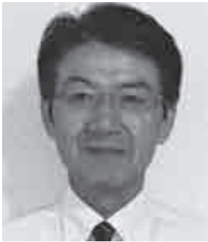
たじま医療生活協同組合 専務理事