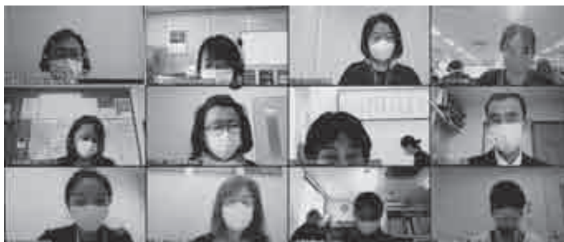
オンライン開催された「ひょうごまるごと健康チャレンジ2021」実行委員会

5月11日(火)、ひょうごまるごと健康チャレンジ実行委員会をオンラインで開催。2021年度は開催時期を夏休みからスタートし、子どもから高齢者まで幅広く参加を呼びかけることにしました。よりわかりやすいチャレンジシートの改善や今後のスケジュール、参加の裾野を広げるためのホームページやSNSの活用等について話し合いました。