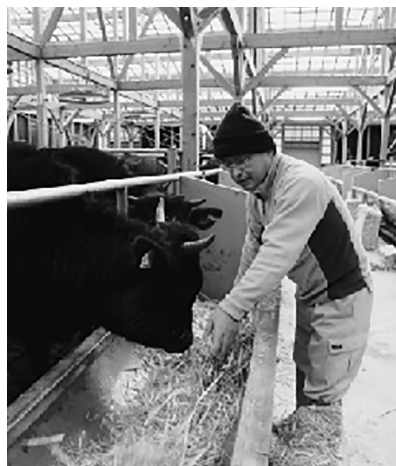
新たな牛舎は約100頭の牛を肥育できます

今後、牛ふん堆肥を施用した米や丹波黒大豆など、地域ぐるみで循環型農業を確立し、農家の所得増大を目指します。