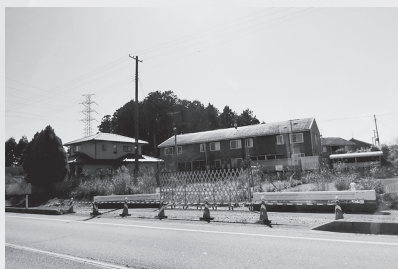
バリケードされた帰還困難区域

せることは当たり前のこと」とお話しがありました。新しくできた富岡駅や防潮堤、海岸から遠く離れた場所に作られた住宅を見学しました。