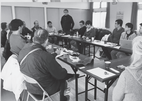
花釜区交流センターでの交流

宮城県南医療生協の山元支部が誕生して3年がたちました。当初20数人だった組合員も47人になり4つの班が活動しています。今年、牛橋に5つめの班が誕生する予定です。「何度ももう駄目かと思うことがあった。その度に神戸からの支援で、また頑張ろうと思う気持ちになった。これからもよろしくお願いします」等、短い時間でしたが、みなさんの8年間の想いを聞きました。出来ることは少ないかもしれませんが、山元町が少しずつでも元気を取り戻すことができれば、つな