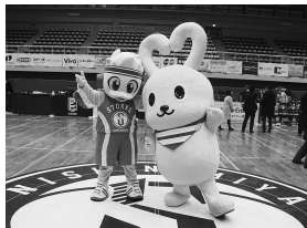
キャラクターも仲良しに

コープこうべは、男子プロバスケットボールリーグB2（2部）に所属する「西宮ストークス」とオフシーズンポンスパー契約を締結しました。これによって宅配カタログ『めーむ』で公式戦チケットを供給するほか、選手を招いての「子どもバスケットボール教室」開催を企画しています。地元チームを応援すること、地域全体の活性化につなげようというものです。