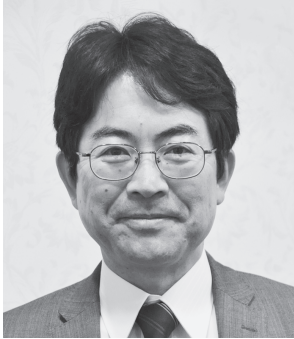
姫路医療生活協同組合 専務理事