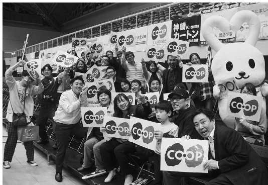
コープでつながっていると応援も楽しい