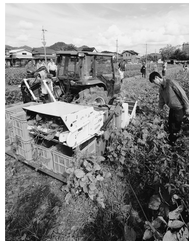
収穫機による省力化を進めています

JAでは、黒大豆の輸出にも力を入れており、28年から台湾でPR活動を続け、同国から視察を受け入れました。