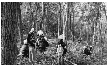
日が差し込む森になりました

作業について指導員の方から説明を受けた後、参加者は周囲に気を配りながら、広葉樹や