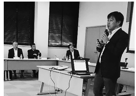
寄付先団体の活動報告会のひとこま