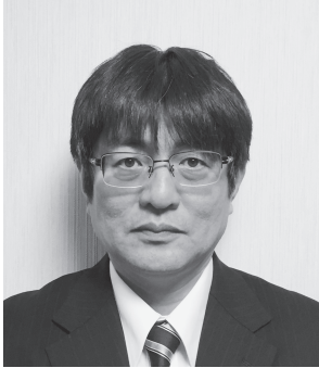
ろっこう医療生活協同組合 専務理事