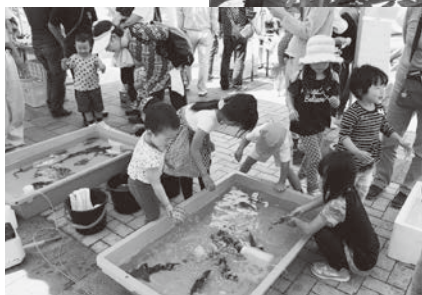
大盛況のタッチングプール