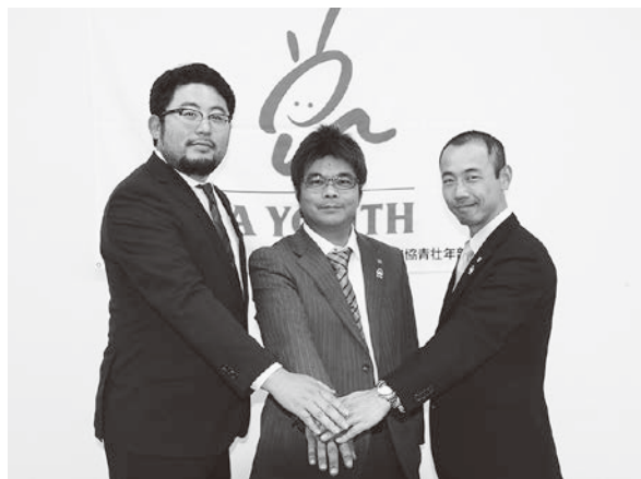
地域に根ざした活動に力を合わせて取り組むことを誓う県青協の役員

平成30年度は、JA青壮年部の地域活動を活性化するとともに、大学生や消費者との交流や新規就農者への支援など、組織の力を合わせて新たな活動にもチャレンジする予定です。