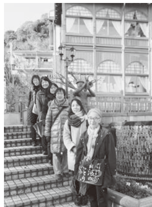
【生活クラブ生活協同組合都市生活】 「大人のリフレッシュツアー」 福島のみなさんに息抜きを目的に神戸 を巡るツアーを行いました。 12月7日(木)～8日(金)