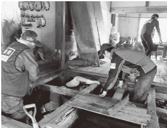
【生活協同組合コープこうべ】 「九州北部豪雨災害ボランティアバス（コープこうべ協働号）」 松末中村地区で民家の床下泥出し作業などの支援を行いました。 9月22日(金)～25日(月)

阪神・淡路大震災、東日本大震災、熊本地震、九州北部豪雨…災害がおこる中、会員生協・団体で様々な支援活動が継続して行われています。(関連ページP.2)