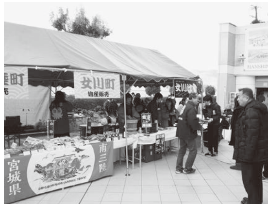
【西宮市職員生活協同組合】 「東北復興支援イベントIN 阪神競馬場」 東日本大震災復興支援として女川汁、女川町・南三陸町の 物産の販売と被災地のパネル展示を行いました。 12月2日(出)