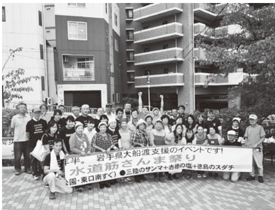
【ろっこう医療生活協同組合】 「大船渡支援・水道筋さんま祭り」 大船渡から届いたさんまを炭焼きし販売。収益金を義援金 として送りました。 10月1日(日)