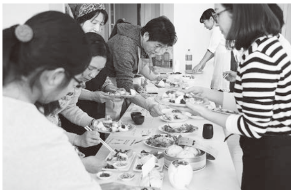
参加者全員で料理の食べ比べ