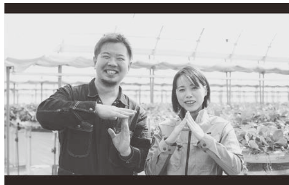
JA グループ兵庫のイメージ・ビデオ

なお、JA グループ兵庫のホームページを4月にリニューアルし、スマートフォンでも閲覧が可能になっています。