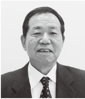
近畿労働金庫兵庫地区本部 本部長 兵庫県生活協同組合連合会 理事