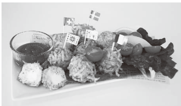
大賞のイカナゴボール

皆さんのアイデア溢れるイカナゴ料理に審査は困難を極めました。大賞にはイカナゴとチーズを丸めて揚げた『イカナゴボール』が、準大賞には『イカナゴ和風アヒージョ』が選ばれました。