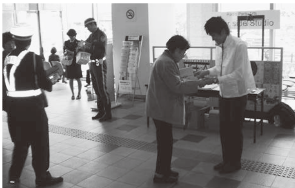
フレッシュなPR活動を行いました

今回は当組合の新人職員も初めての広報活動を行いました。「組合員の方からお世話になってますよとあなたがたいへん声をかけていただき、はげみになりました。もっと多くの方に神戸市民生協の共済を知らせていきたいです」と、市民の