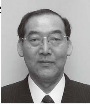
西宮市民共済生活協同組合 常務理事