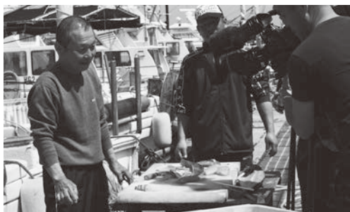
テレビ取材に応じる播磨組合長

播磨組合長によると、激減したサワラ資源の回復を図るため、10年以上前からサワラの受精卵を放流したり、稚魚を育てる中間育成や、小型の魚が網に掛からないようにする網目規制といった資源管理のほか、沖が混乱するのを避ける時間差出漁、操業時間短縮、すぐに氷水でしめて鮮度保持に努めるといった操業・価格向上の取り組みを行っているとのことで、サワラにかかる熱い想いが伝わってきました。